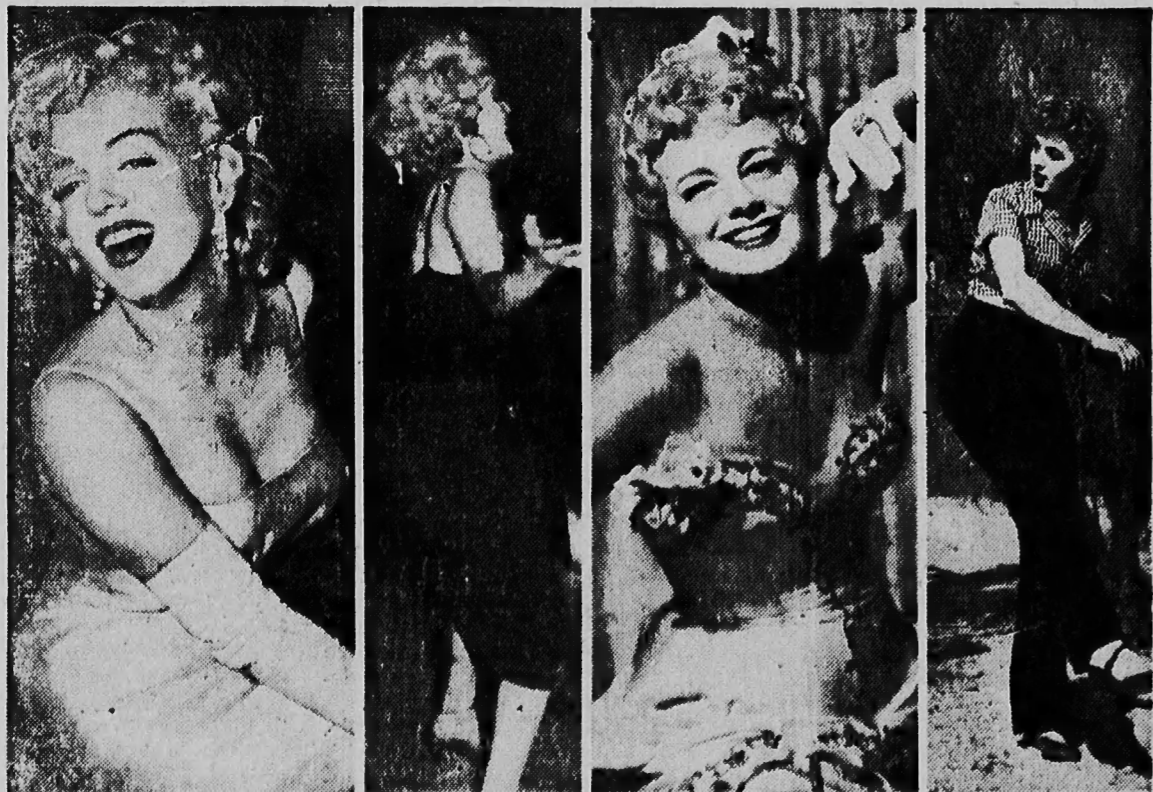
Marilyn Monroe's stordig?